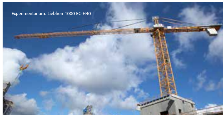
Experimentarium: Liebherr 1000 EC-H40

”1000 EC-H40 kranen vil være i brug på Hellerup Havn til ud på efteråret”.