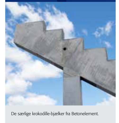
De særlige krokodille-bjælker fra Betonelement.

14.347 m 2 huldæk 13.445 m 2 vægge 863 tons trapper 1.099 stk. trin 528 stk. bjælker 969 stk. tribuner 376 stk. søjler