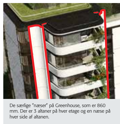
De særlige "næser" på Greenhouse, som er 860 mm. Der er 3 altaner på hver etage og en næse på hver side af altanen.