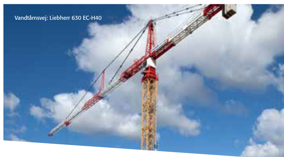
Vandtårnsvej: Liebherr 630 EC-H40