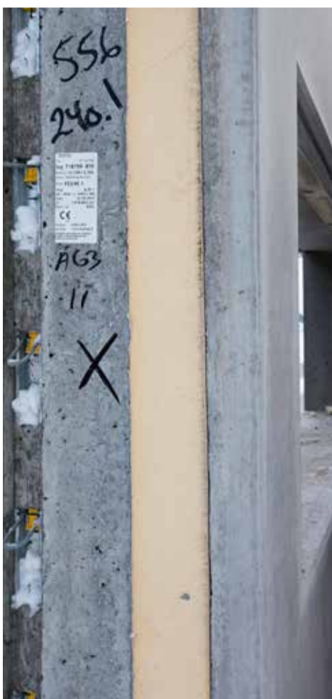
Eksempel på elementtykkelse med PIR-isolering

- Mere isolering er ikke nødvendigvis den rigtige måde at løse energi-kravene på. Vi skal isolere på den mest hensigtsmæssige måde, samtidig med at vi tænker energi samlet ind i byggeriet helt fra starten. Alle i branchen har en fælles udfordring, også arkitekter, ingeniører og bygherrer – og vi hjælper gerne med at finde de rigtige løsninger. Gerne helt fra begyndelsen af projekteringsfasen, er de enige om. ■