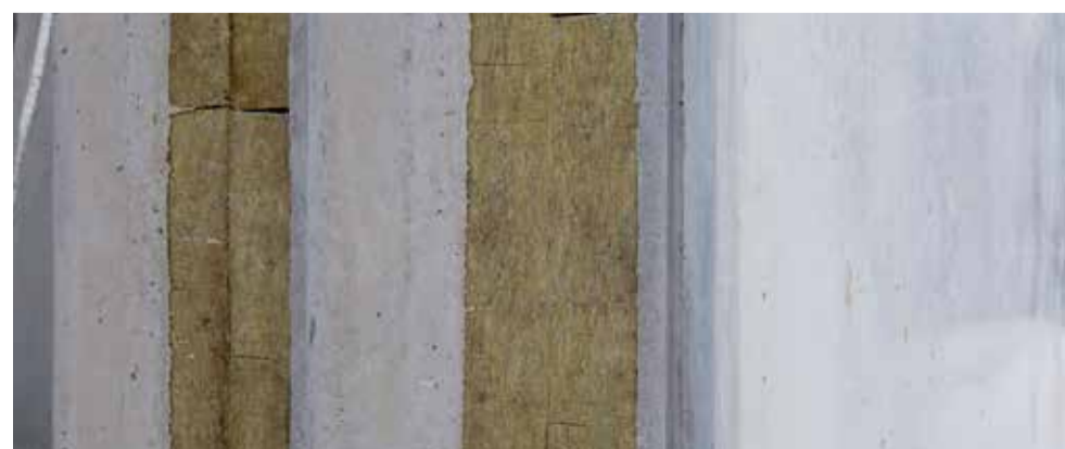
Eksempel på elementtykkelse med mineraluld-isolering